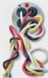
Ohne / without BRETEC®

With Bretec® rotary contact technology the reel body turns, and the drum centre stays still. This special system allows winding, even with connected appliances.